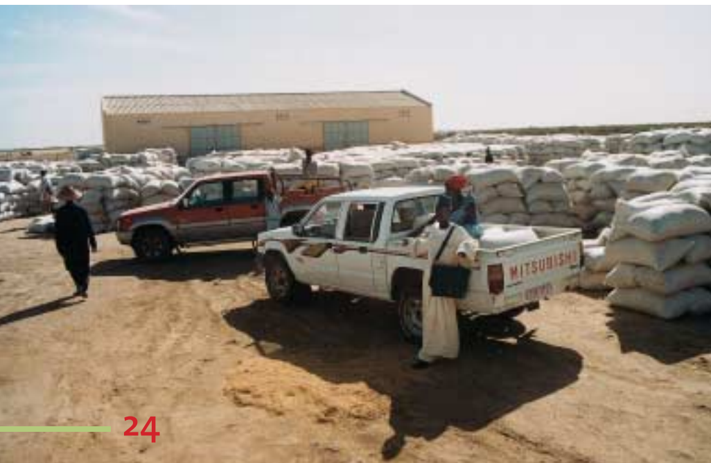
Stockage de la récolte de riz dans une coopérative : l'Union de Boundom.